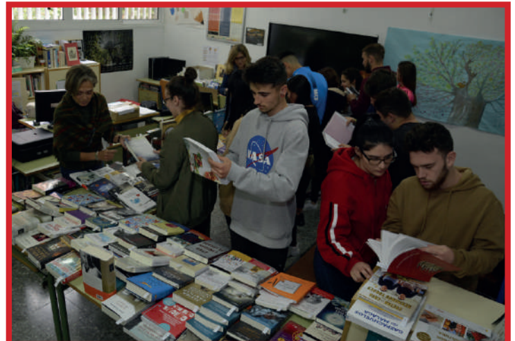
Feria del Libro