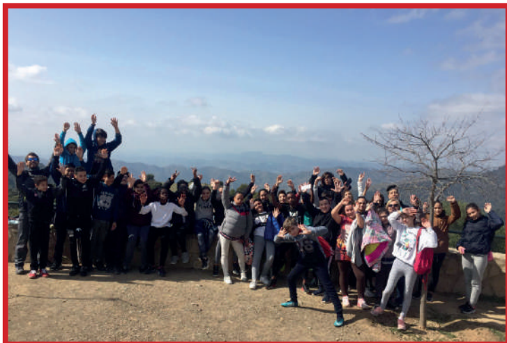
Montes de Málaga