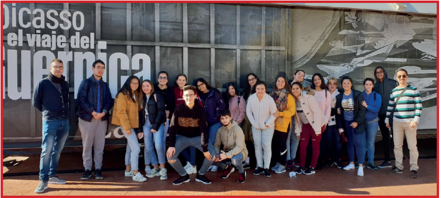
Picasso "El viaje del Guernica"