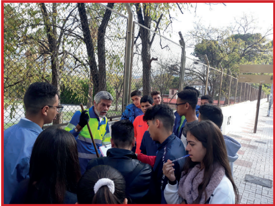
Cuidando Mi Barrio